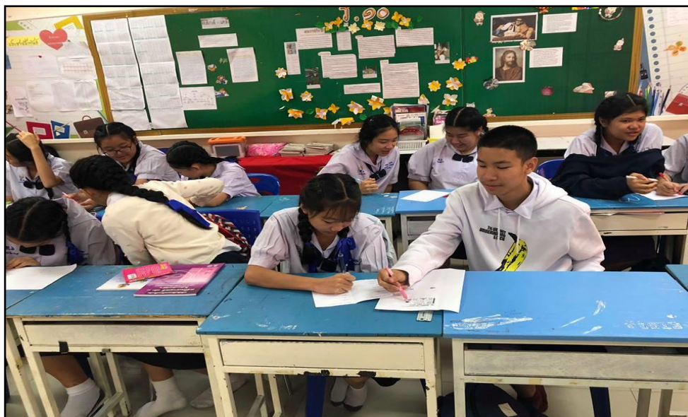
ภาพ 5 แสดงการมีส่วนร่วมในการเรียน