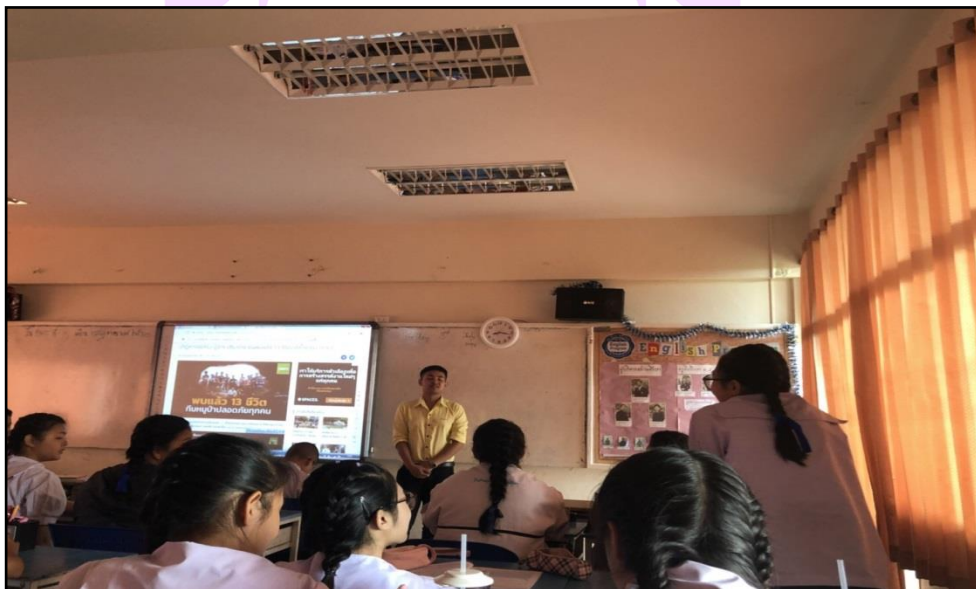
ภาพ 2 แสดงการมีส่วนร่วมในการเรียน