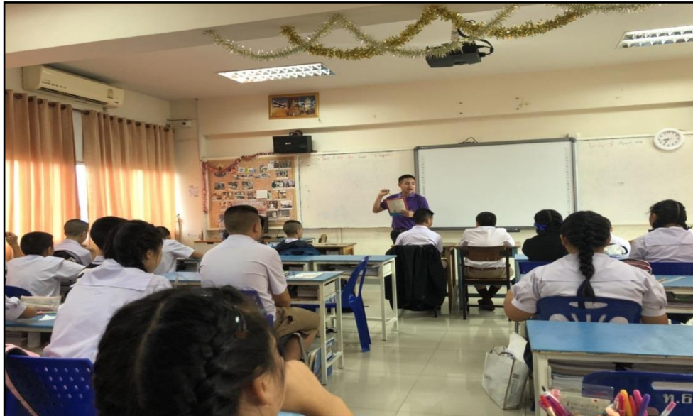
ภาพ 1 แสดงบรรยากาศการจัดการเรียนการสอน