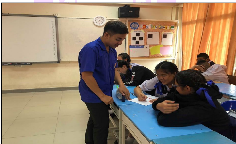
ภาพ 4 แสดงการจัดการเรียนการสอน