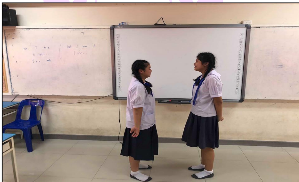
ภาพ 6 แสดงการสนทนาภาษาอังกฤษ