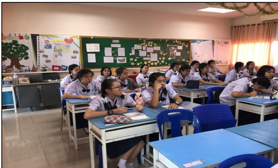
ภาพ 3 แสดงบรรยากาศในชั้นเรียน