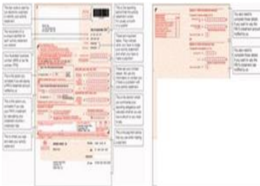
ภาพ 2 แสดงใบรายงานงบบกกิจการ