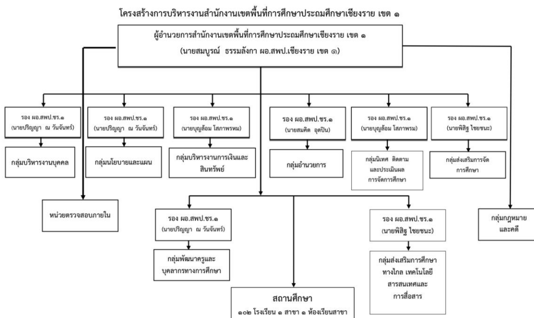
ภาพ 2 แสดงโครงสร้างการบริหารของสำนักงานเขตพื้นที่การศึกษา ประถมศึกษาเชียงราย เขต 1