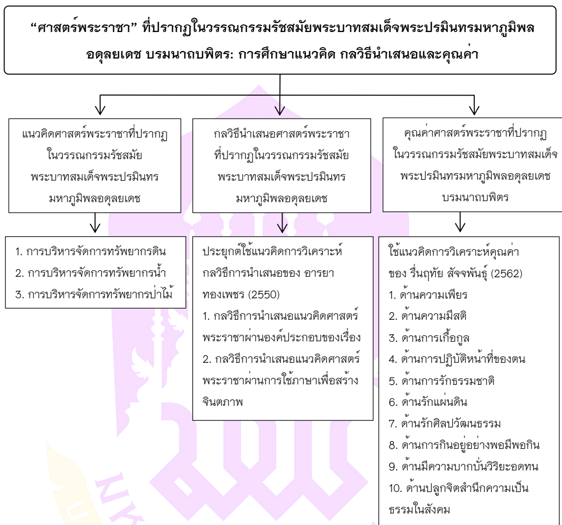
ภาพ 1 แสดงกรอบแนวคิดการวิจัย