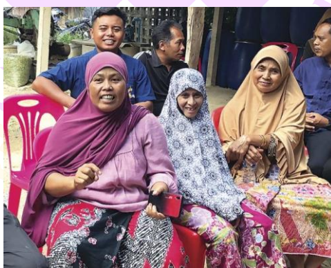
ภาพ 13 แสดงคนภาคใต้นุ่งผ้าปาเต๊ะ