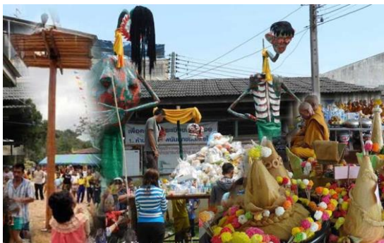
ภาพ 6 แสดงงานสารทเดือนสิบ