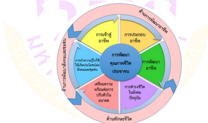
ภาพ 1 การพัฒนาคุณภาพชีวิตประชาชน

การจัดการศึกษาต่อเนื่อง เป็นการจัดการเรียนรู้เพื่อให้กลุ่มเป้าหมายประชาชนทั่วไปได้รับการเรียนรู้ที่สอดคล้องกับความต้องการ ซึ่งประกอบไปด้วย การศึกษาเพื่อพัฒนาอาชีพ การศึกษา เพื่อพัฒนาทักษะชีวิต การศึกษาเพื่อพัฒนาสังคมและชุมชน และการเรียนรู้หลักปรัชญาของเศรษฐกิจพอเพียง โดยมีกรอบการจัดการศึกษาต่อเนื่อง ดังนี้