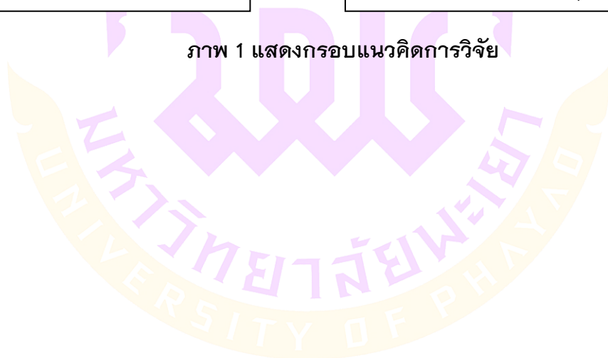
ภาพ 1 แสดงกรอบแนวคิดการวิจัย