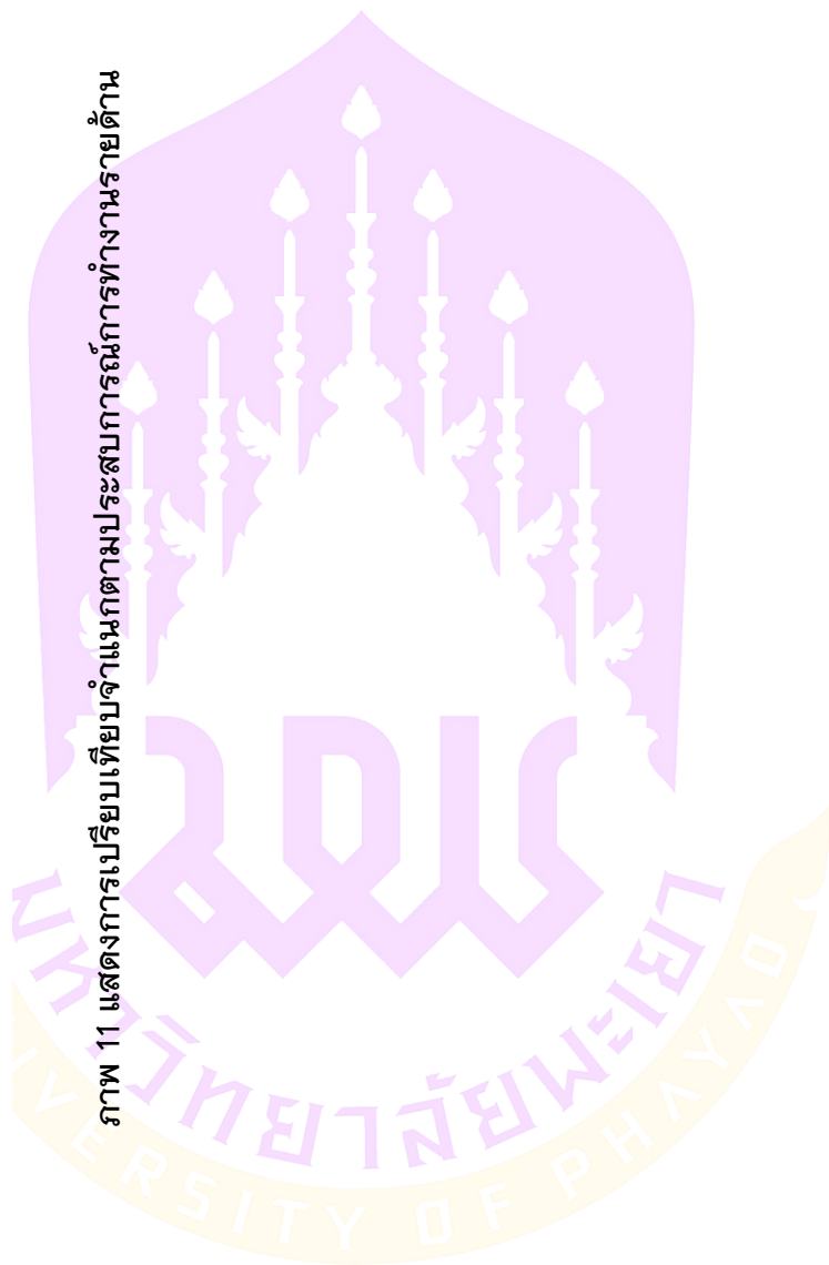
ภาพ 11 แสดงการเปรียบเทียบความจำเป็นต่อการปฏิบัติงานรายด้าน

*. The mean difference is significant at the 0.05 level.