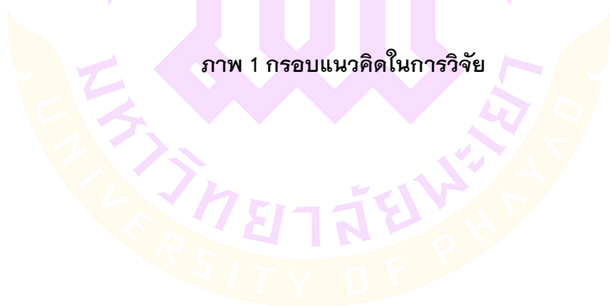
ภาพ 1 กรอบแนวคิดในการวิจัย

ระดับการยอมรับนักการเมืองที่เป็นเพศ หญิงแบ่งตามคุณลักษณะของนักการเมือง หญิง 6 ด้าน 1) คุณลักษณะทางด้านจิตใจ 2) คุณลักษณะทางด้านความรู้ 3) คุณลักษณะทางด้านความคิด 4) คุณลักษณะทางด้านพฤติกรรม 5) คุณลักษณะทางด้านคุณธรรม จริยธรรม 6) คุณลักษณะด้านการบริหาร