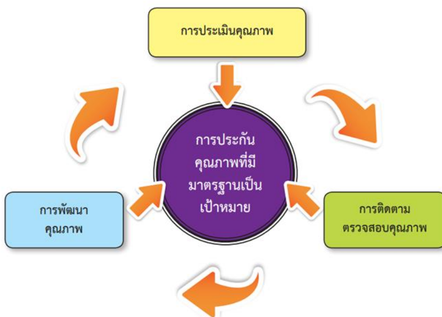
ภาพ 1 ระบบการประกันคุณภาพการศึกษา