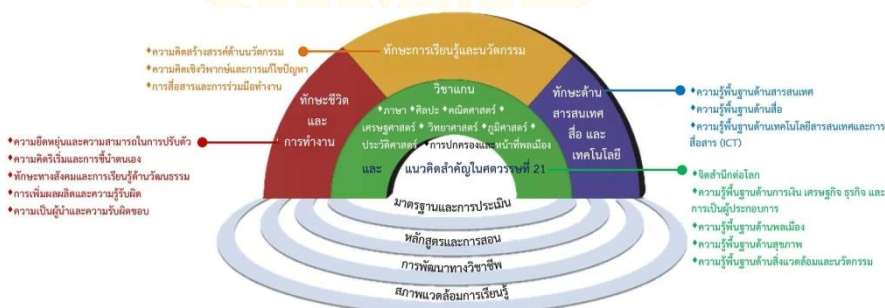
ภาพ 1 แสดงกรอบความคิดหลักสำหรับทักษะแห่งศตวรรษที่ 21

องค์กรเพื่อความร่วมมือทางเศรษฐกิจและการพัฒนา (OECD, 2005 อ้างอิงใน สุภรรยา อังคระษี, 2565, หน้า 19) ได้เสนอแนวคิดเกี่ยวกับทักษะแห่งศตวรรษที่ 21 ดังนี้